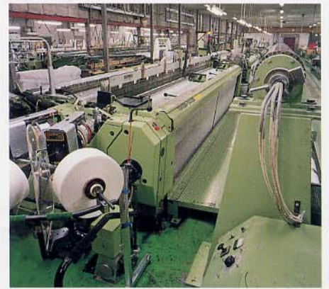
・ スイス製のスルザーウィービングマシン での総カミ製織