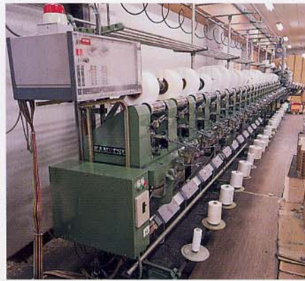
・ 緯糸のリワインド ~ワインダー~ (ウスターで糸をクリーニング)